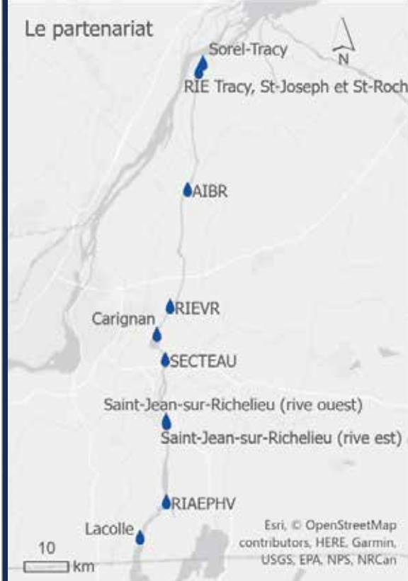
Figure 1: Le partenariat

Un partenariat entre ces 10 installations a été créé pour élaborer un plan de protection des sources d'eau potable.