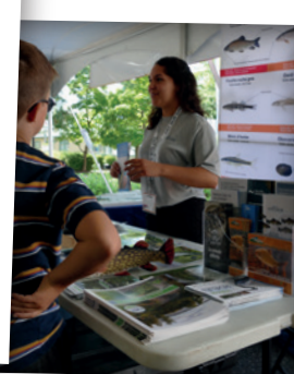
FESTIVAL KAPUT 2022