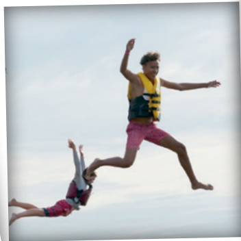
GRAND SPLASH 2022