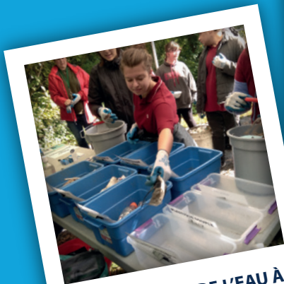
LES GARDIENS DE L'EAU À BOUCHERVILLE

La prochaine année nous verra poursuivre nos efforts de communication et de diffusions et nous souhaitons, selon nos moyens et ressources, pouvoir explorer de nouveaux moyens pour rejoindre les différents publics de notre territoire qui compte près d'un millions d'habitants.