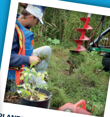
PLANTATION J'ADOpte UN COUR D'EAU AVEC LE G3E