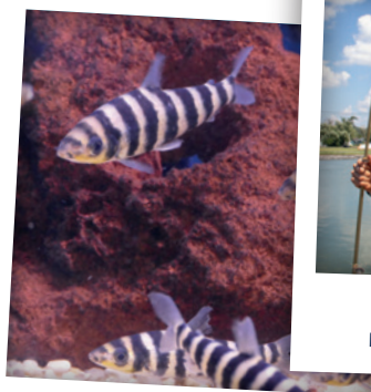
SENSIBILISATION PROJET AQUARIOPHILE