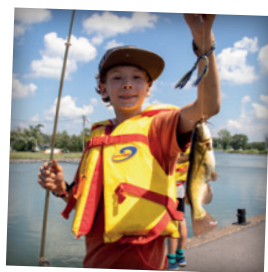
JOURNÉE DE LA PÊCHE À CHAMBLY