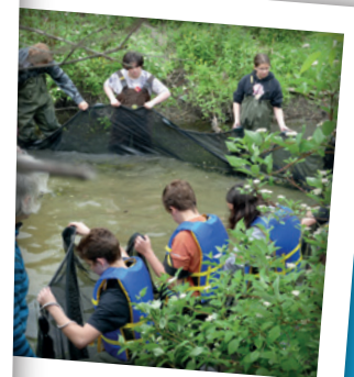
ADOpte UN COUR D'EAU AU RUISSEAU MASSÉ