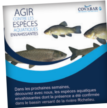
SENSIBILISATION DES ESPÈCES AQUATIQUE ENVAHISSANTE