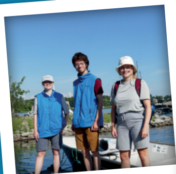
SENSIBILISATION ET GARDIENNAGE ÉTÉ 2022